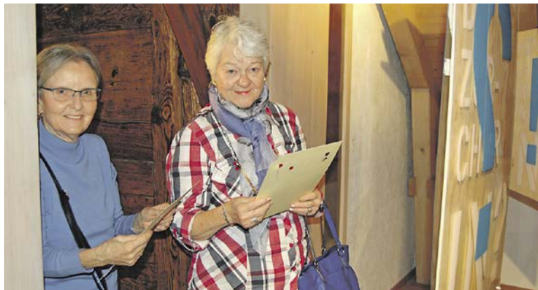
Schon viele Besucher wagten sich an die Fragen und überprüften ihr Wissen rund um Zürich.

Auch die Sprache wird beleuchtet. «Zürdütsch ist der schönste Dialekt»